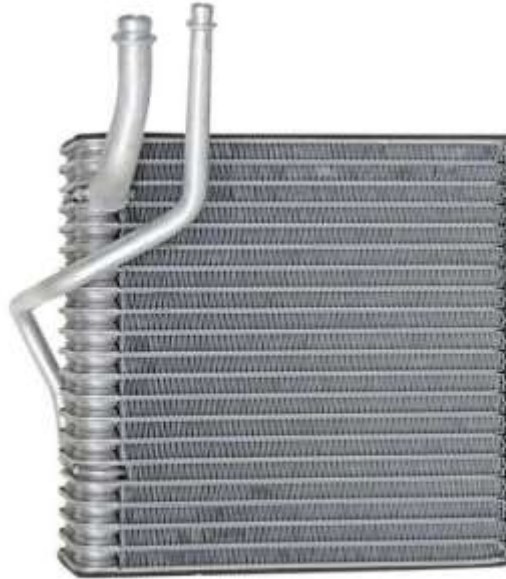
Figura 2. Evaporador de aire acondicionado automotriz.

Los resultados del examen práctico son en dos categorías, de acuerdo a los puntajes obtenidos en los rubros de habilidades genéricas, habilidades específicas, y actitudes. La puntuación que se logre de la prueba estará determinada por el número de puntos acumulados. Tal como se muestra en la tabla siguiente: