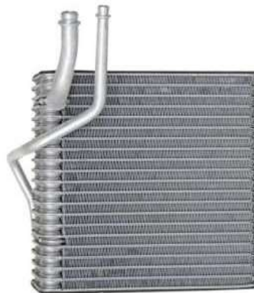
Figura 2. Evaporador de aire acondicionado automotriz.